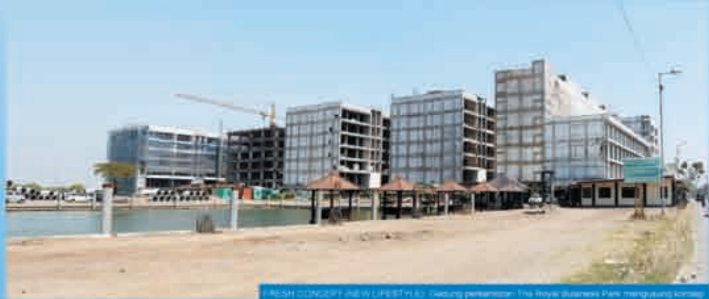
FRESH CONCEPT NEW LIFESTYLE: Gedung pemukiman The Royal Business Park mengkonsepkan modern luxury. Tempat pemukiman padat di lokasi The Royal Business Park.