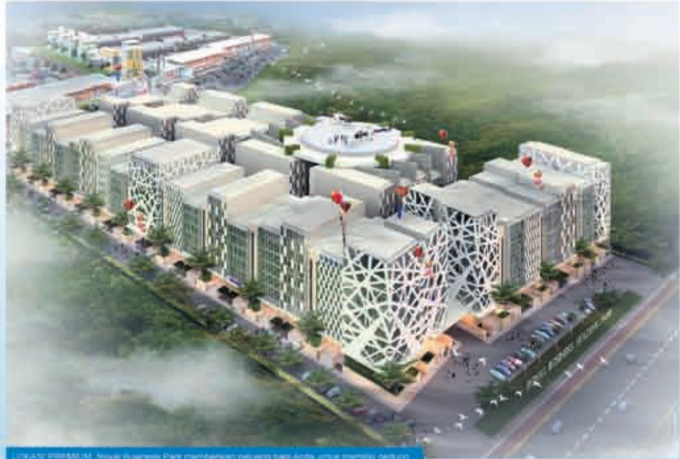
LOKASI PREMIUM: Royal Business Park memberikan peluang bagi Anda untuk memiliki gedung perkantoran prestisius yang dekat dengan Bandara Internasional Juanda.

Ditambahkan lagi oleh Klemens bahwa proyek-proyek Sipoa Group punya akses yang istimewa. Diantaranya dekat dengan Outer East Ring Road( OECR) atau Jalan Lingkar Timur yang sebentar lagi dikerjakan.