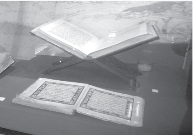
BERSEJARAH: Beberapa koleksi naskah kuno di Museum Mpu Tantular, Buduran.