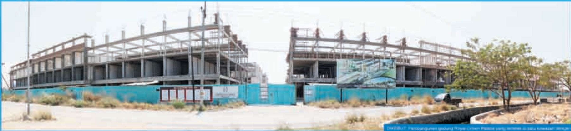
DIKREKUT: Pembangunan gedung Royal Crown Palace yang terletak di satu kompleks dengan proyek pembangunan Royal Business Park.