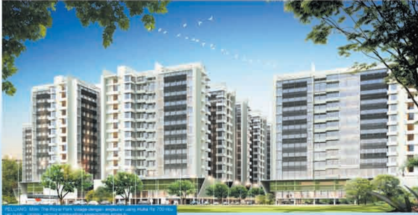
RELUANG: Alami The Royal Park Village dengan lingkungan yang hijau. Mulai Rp. 700 juta per bulan, jangan lewatkan kesempatan emas ini.

Semua proyek Sipoa Group terletak dekat dengan akses Outer East Ring Road (OERR) atau jalan lingkar luar timur