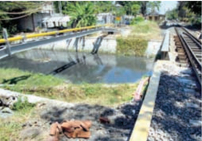
SEGERA DISAMBUNG: Dinas PU Bina Marga Sidoarjo segera membangun jembatan di jalur frontage road di kawasan Buduran (depan pabrik Avian), untuk menyambung akses yang terputus karena ada sungai, Kamis (27/8).