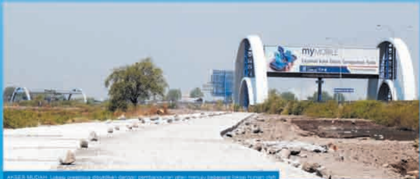
ANDES MUDAH: Lokasi premium ditawarkan dengan pembangunan jalan menuju bandara akses langsung dari Sipoa Group. Akses jalan Royal Mutiara Residence 3.