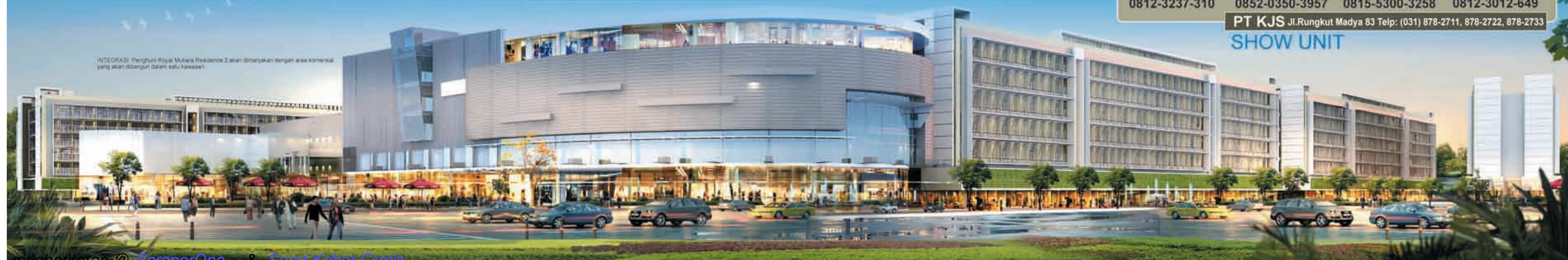
INTEGRASI: Penghuni Royal Mutiara Residence 3 akan dinikmati dengan area komersial yang akan dibangun dalam satu kawasan