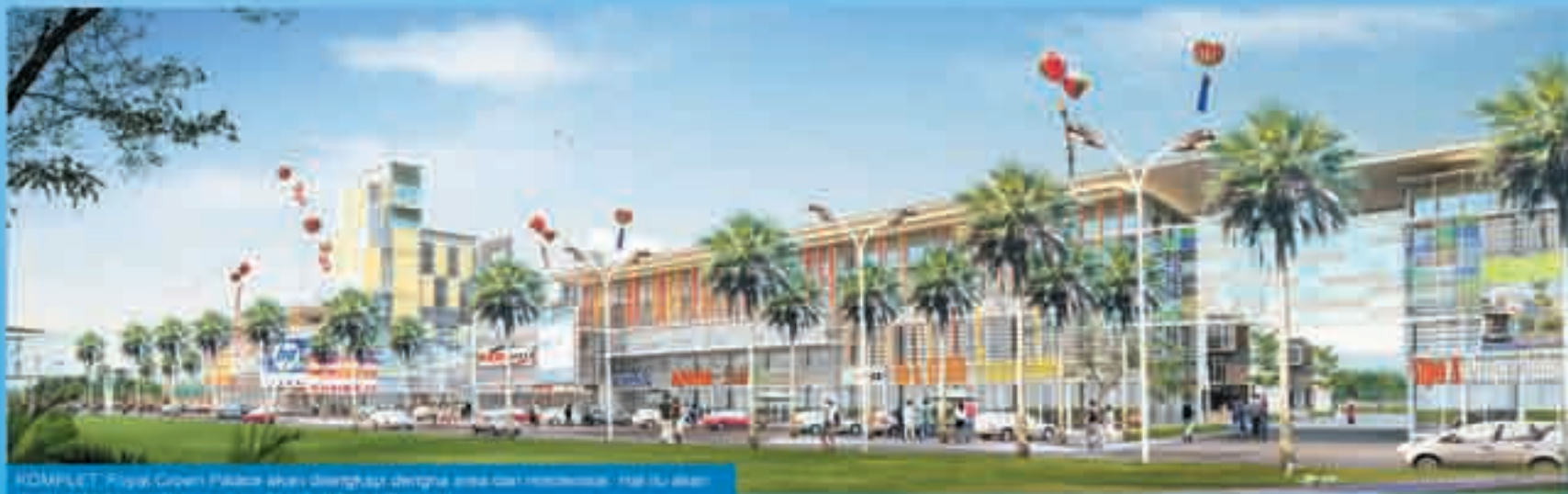
KOMPLEK: Royal Crown Palace akan dibangun dengan area komersial. Hal ini akan memudahkan penghuni memenuhi kebutuhan sehari-hari.