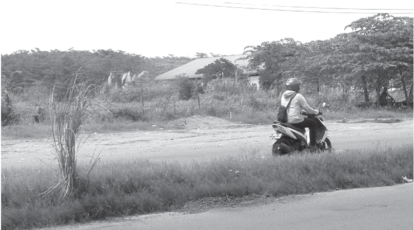
MASIH ALOT: Lahan di kawasan Balongbendo yang akan dibangun eksit tol Krian-Bunder.