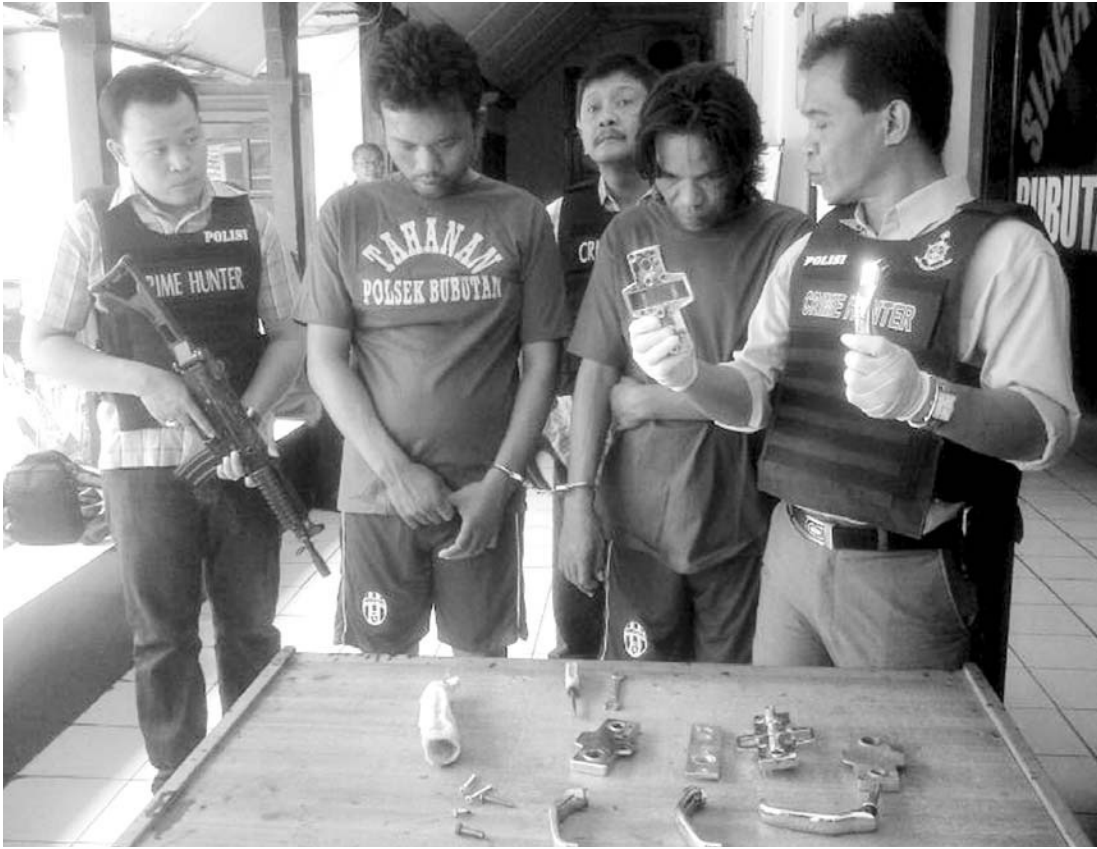
KEPEPET: Dua tersangka bersama barang bukti berupa handle pintu kereta yang dicuri dari gerbong yang berhenti di Stasiun Pasar Turi, Surabaya.