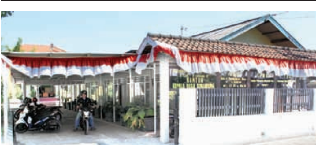
DITINGGAL KADES: Suasana Balai Desa Semambung Kecamatan Gedangan. Meski kadesnya ditahan, pelayanan pemerintahan di desa tetap berjalan.