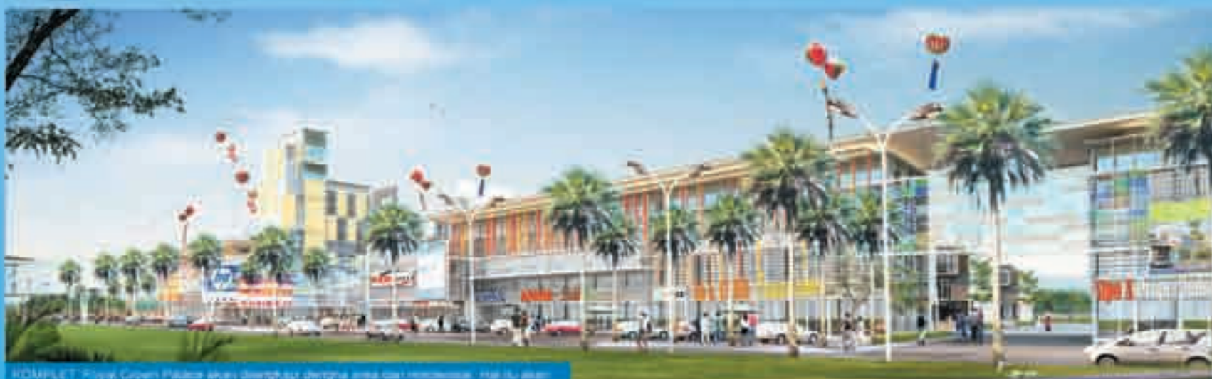
KOMPLEK: Royal Crown Palace akan dibangun dengan area komersial. Hal ini akan memudahkan penghuni memenuhi kebutuhan sehari-hari