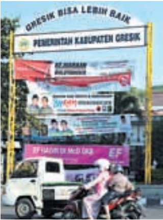
BERTEBARAN : Spanduk dan baliho pasangan calon bupati di Kabupaten Gresik akan ditertibkan panwaslu kalau tidak di turunkan.