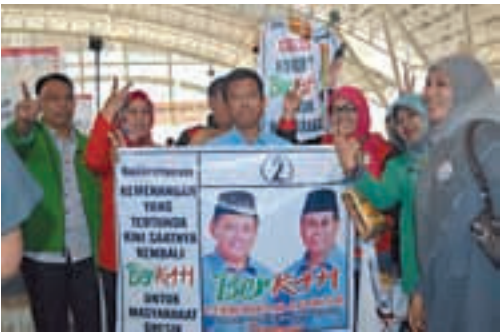
DUA JARI : Kader partai pengusung BerKAH menunjukkan salam dua jari.