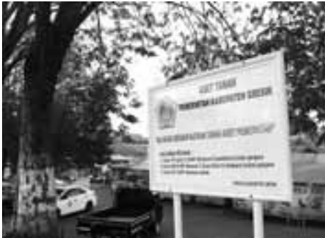
YUdhiRADAR GRESIK RELOKASI : Sentra PKL GKB segera dipindahkan ke Randuagung.

Sebenarnya relokasi sudah disiapkan sejak awal tahun lalu. Lewat APBD, pemkab-DPRD menyiapkan anggaran Rp 1,5 miliar. Namun, dana itu awalnya hanya untuk rekondisi semua stan di Pujasera GKB. Keberadaan pujasera GKB maupun eks sub-terminal Randuagung sudah mendapat sorotan cukup lama. Pujasera GKB kini ibarat mati suri. (rof/c4/ris)