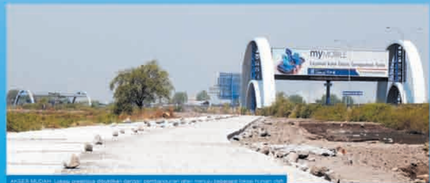
ANDES MUDAH: Lokasi premium ditawarkan dengan pembangunan jalan menuju bandara akses langsung ke Bandara Internasional Juanda