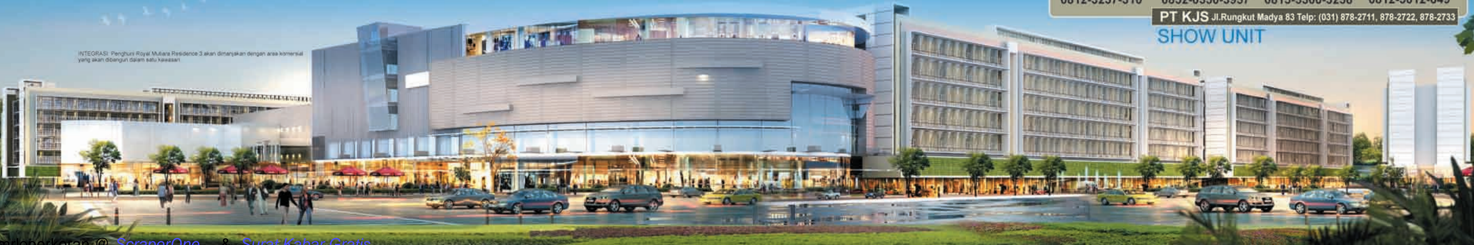
INTEGRASI: Penghuni Royal Mutiara Residence 3 akan dinikmati dengan area komersial yang akan dibangun dalam satu kawasan.