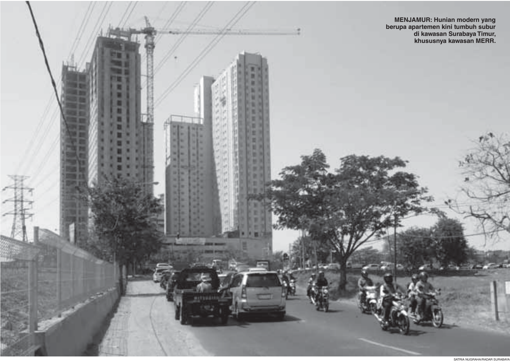
MENJAMUR: Hunian modern yang berupa apartemen kini tumbuh subur di kawasan Surabaya Timur, khususnya kawasan MERR.