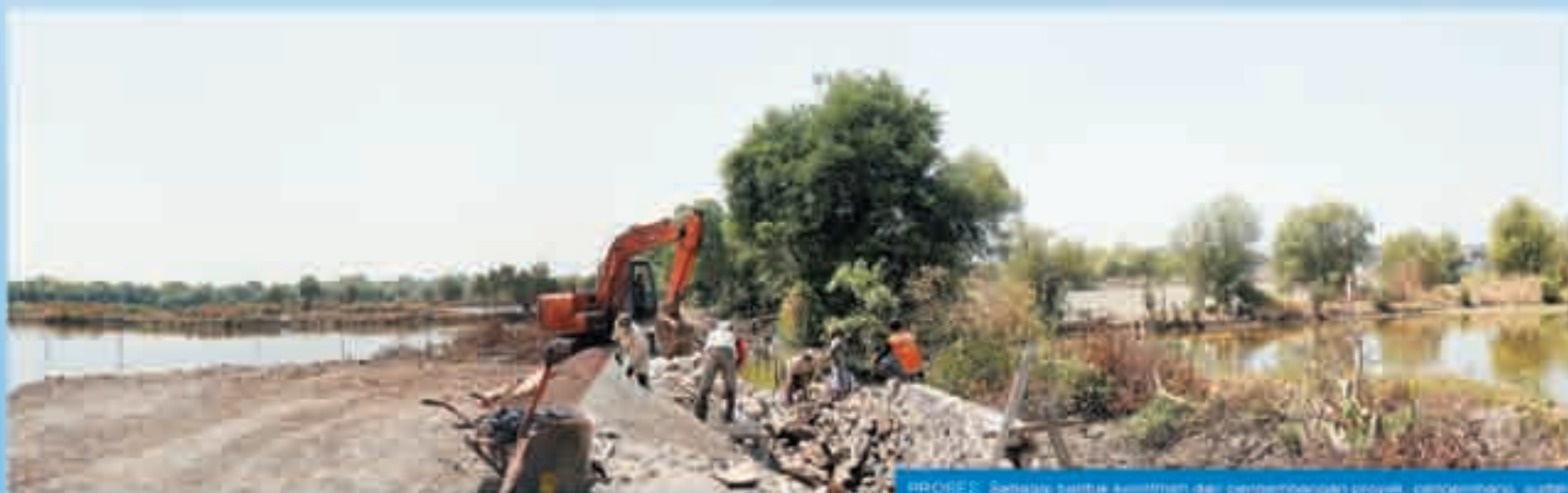
PROGRES: Semangat aktivitas dan pengembangan proyek, pengembang sudah membangun area jalan The Royal Park Village