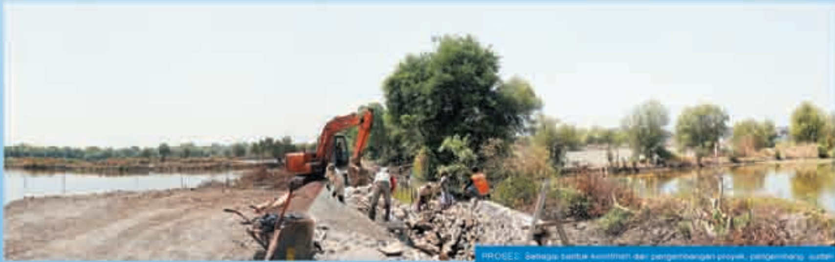
PROGRES: Semangat aktivitas dan pengembangan proyek, pengembang sudah membangun area jalan The Royal Park Village.