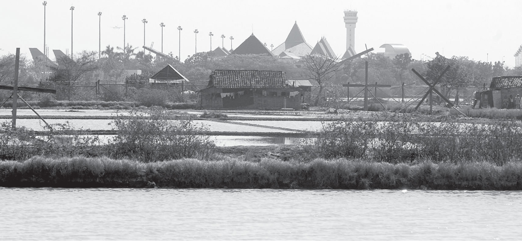
MASIH MENUNGGU: Kawasan tambak di Desa Segorotambak, Sedati, yang diduga terkena perluasan Bandara Juanda.