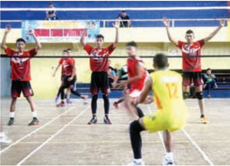
KEMBALI KE KLUB: Tim bola voli putra Sidoarjo saat bermain di Porprov Banyuwangi, pertengahan Juni lalu.