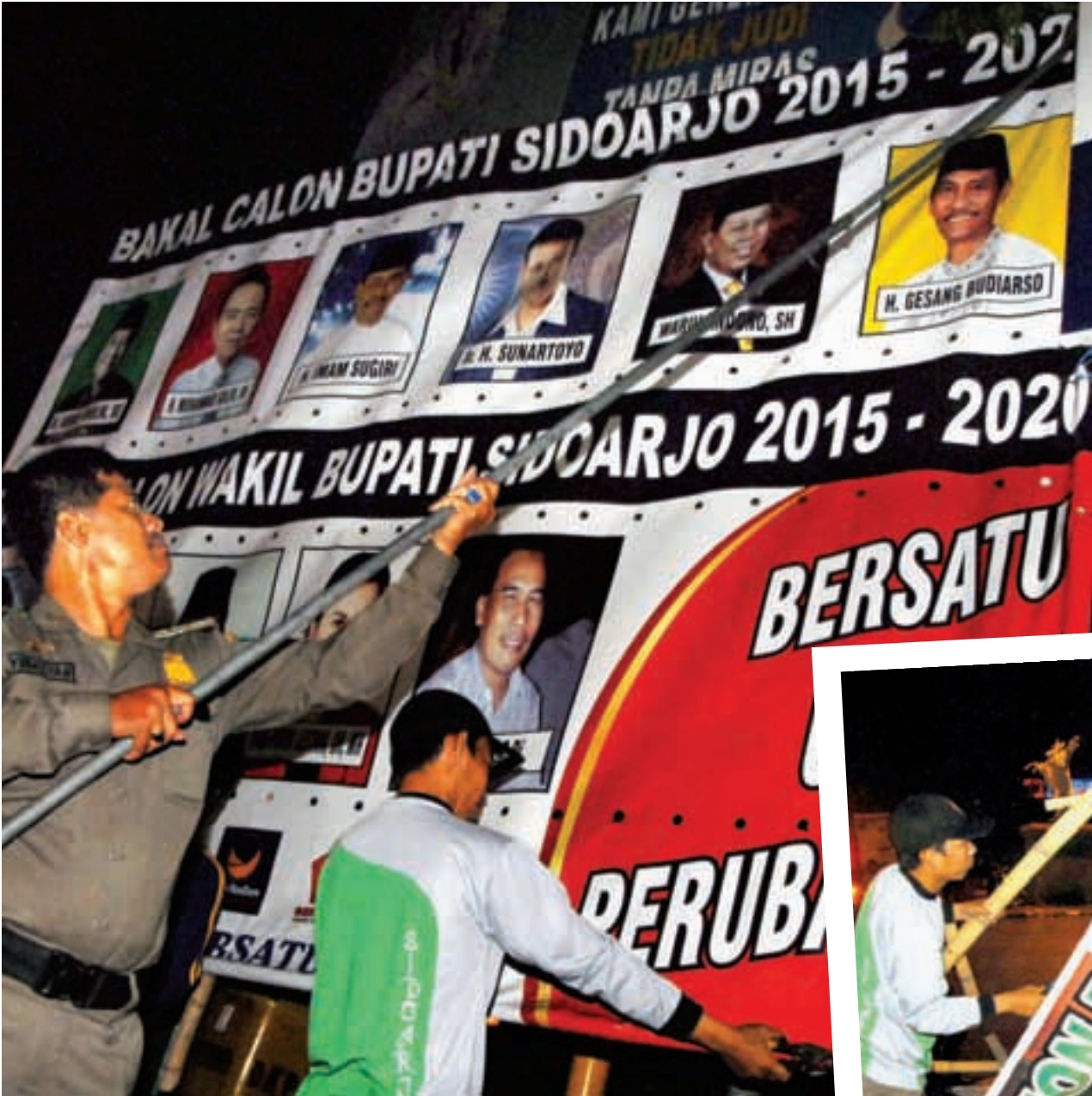
DITERTIBKAN: Personel gabungan dari KPU, Panwas dan Satpol PP Sidoarjo, melakukan penertiban terhadap atribut cabup dan cawabup Sidoarjo di area bundaran GOR, Rabu malam (26/8).