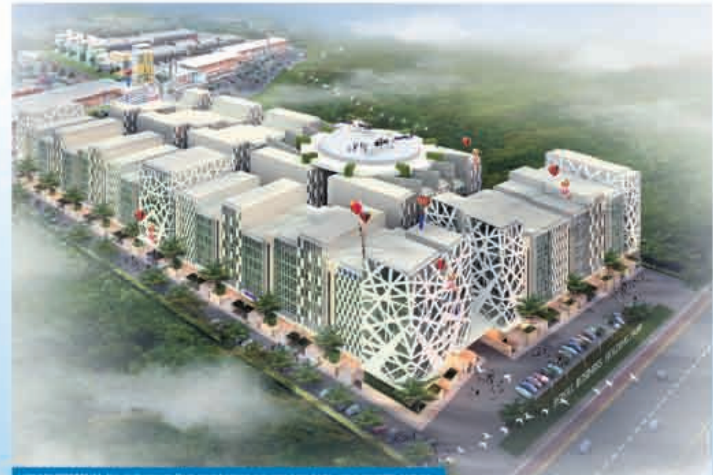
LOKASI PREMIUM: Royal Business Park memberikan peluang bagi Anda untuk memiliki gedung perkantoran prestisius yang dekat dengan Bandara Internasional Juanda

Ditambahkan lagi oleh Klemens bahwa proyek-proyek Sipoa Group punya akses yang istimewa. Diantaranya dekat dengan Outer East Ring Road( OECR) atau Jalan Lingkar Timur yang sebentar lagi dikerjakan.