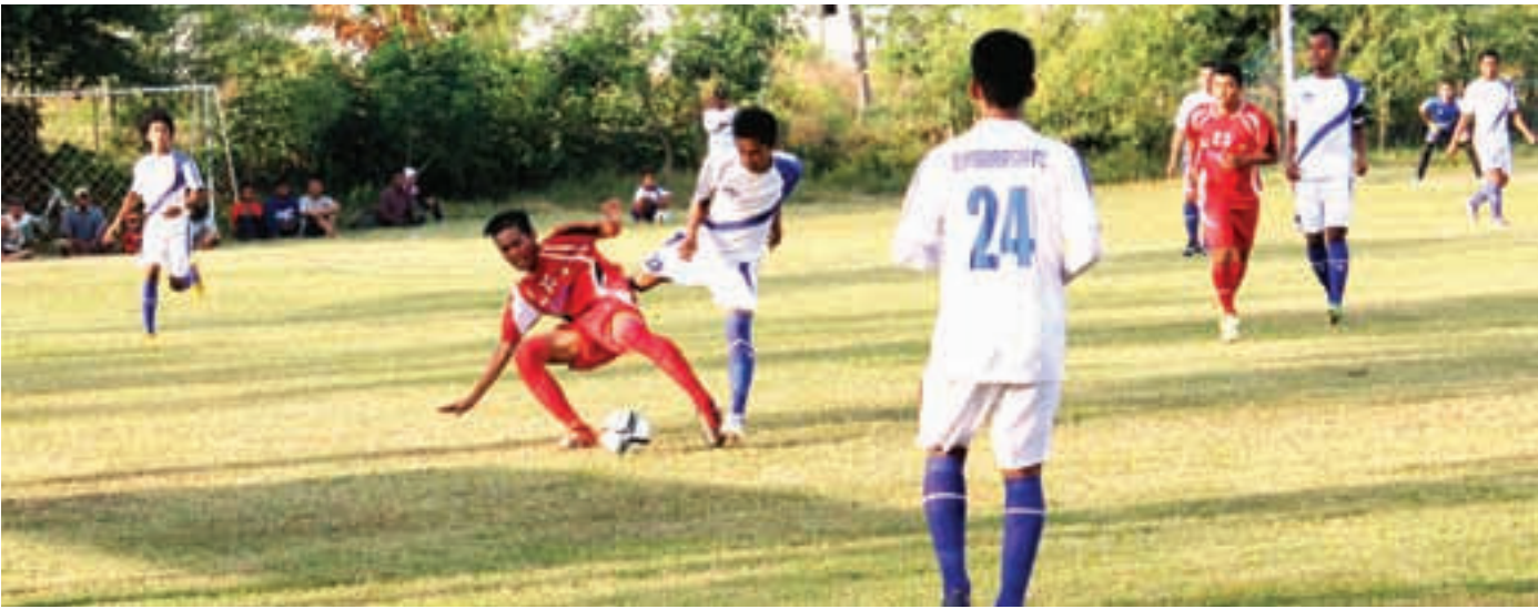
EVALUASI: Salah satu pertandingan kompetisi kelas utama Askab PSSI Sidoarjo di Lapangan Banjarsari, Buduran.