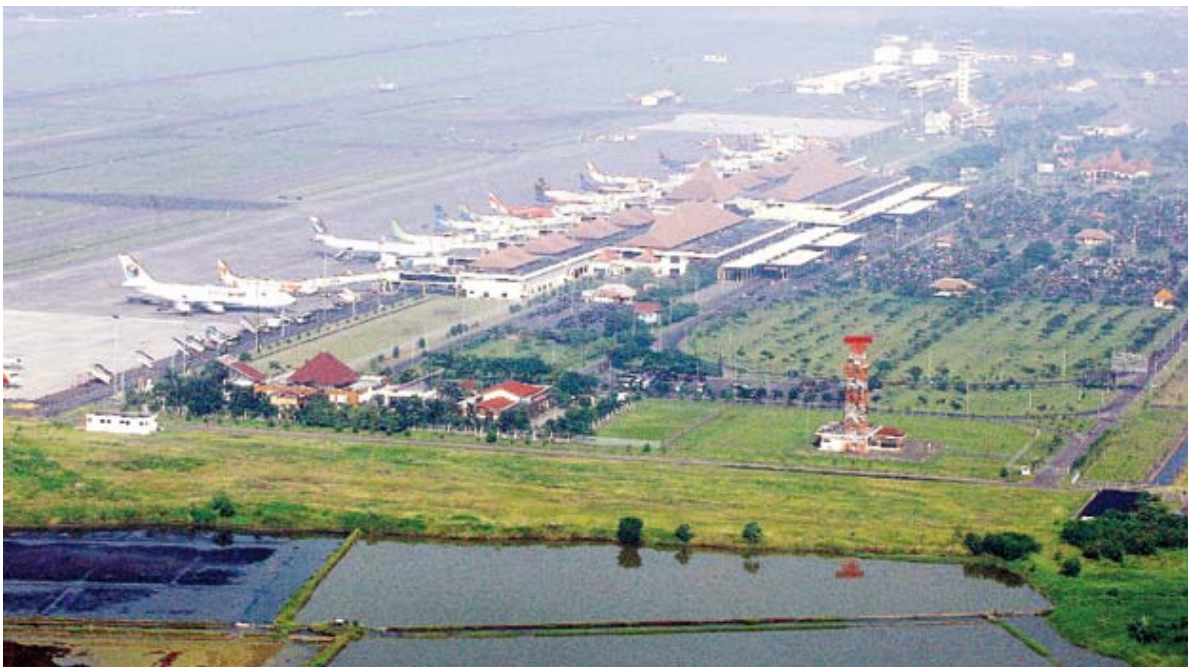
TAMPAK DARI UDARA: Lahan di sekitar Bandara Juanda yang peruntukkannya diatur dalam Rancangan Peraturan Daerah (Raperda) tentang Kawasan Keselamatan Operasional Penerbangan (KKOP).