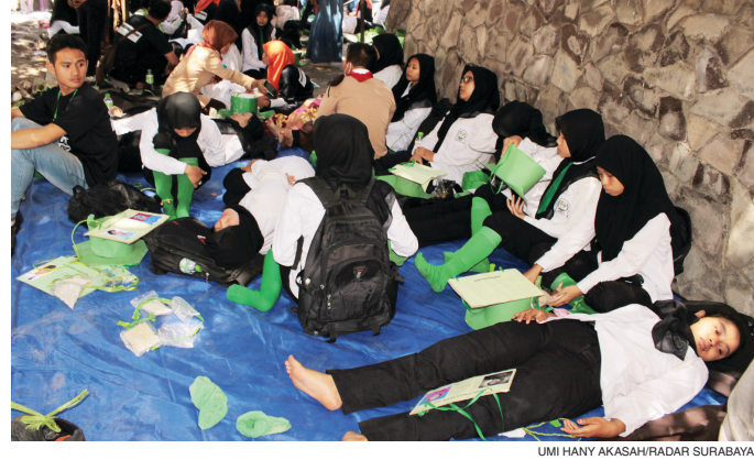
BERGELIMPANGAN: Para maba UINSA yang jatuh pingsan di tenda-tenda darurat untuk diberi perawatan.