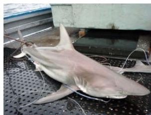
Cá mập lai tìm thấy ở vùng biển của Australia

Jess Morgan, một nhà nghiên cứu của Đại học Queensland tại Australia, nói rằng ông và các đồng nghiệp phát hiện những con cá mập lai trong một chuyến nghiên cứu ở vùng biển phía đông của Australia. Chúng là hậu duệ của hai loài cá mập vây đen là Carcharhinus limbatus (phân bố khắp toàn cầu) và Carcharhinus tilstoni (chỉ sống tại vùng biển ấm của Australia), AFP đưa tin.