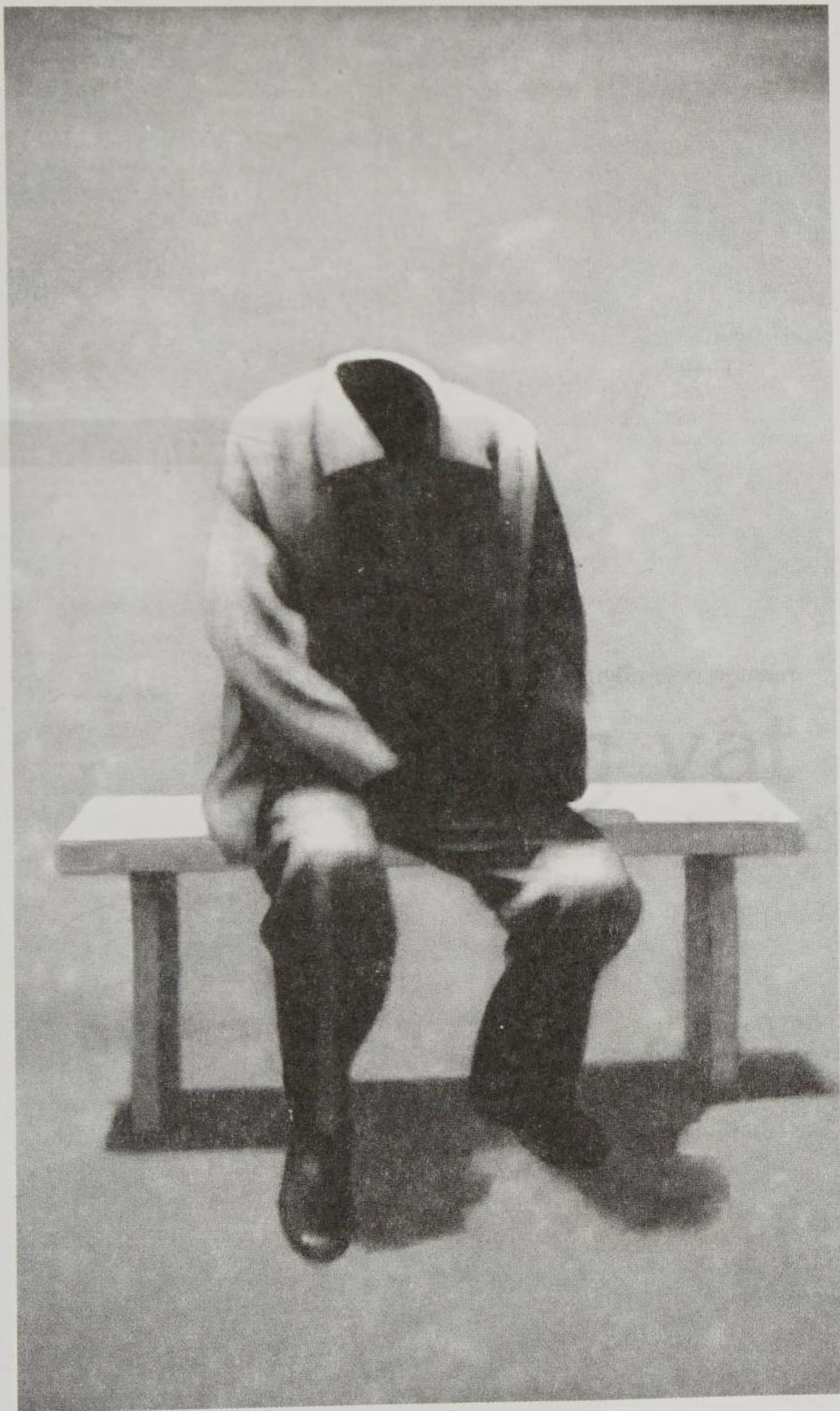
[ tranh nguyên thái tuần ]