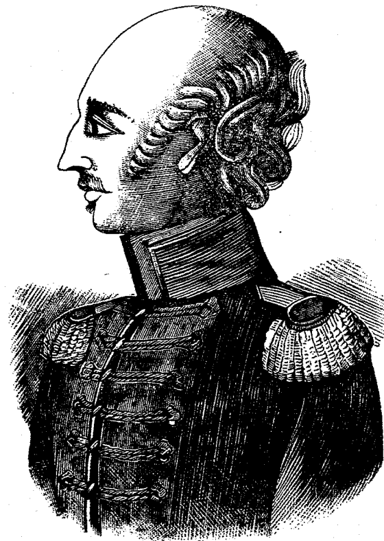
Ὁ Στρατάρχης Δημήτριος Ὑψηλάντης.

εἰς τὴν Τουρκίαν, τῇ προτάσει δὲ τοῦ Γαλλοῦ ἀντιπροσώπου ἐτίθετο καὶ ὁ μυστικὸς ὅρος ἐν τῷ πρωτοκόλλῳ, ὅτι ἂν ἡ Ὑ. Πύλη ἐντὸς μηνὸς δὲν δεχθῇ, αἱ τρεῖς Δυνάμεις Ἀγγλία, Ρωσία καὶ