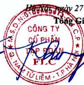
HƯƠNG TRẦN KIỀU DUNG